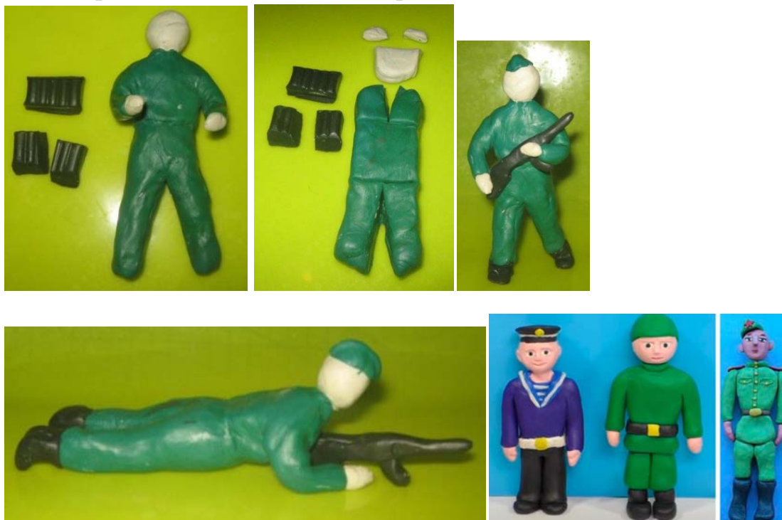
.Приложение №2. к КОД. Фото-подтверждение