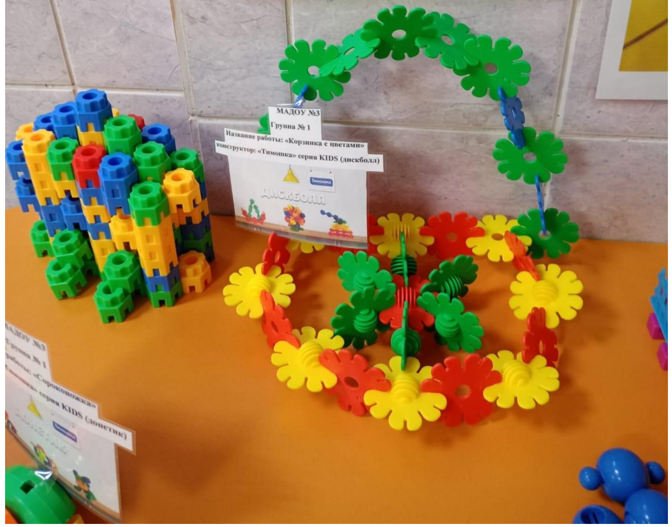
МАДОУ №3 Группа № 1 Название работы: «Корзинка с цветами» конструктор: «Тимошка» серии KIDS (дискболл)