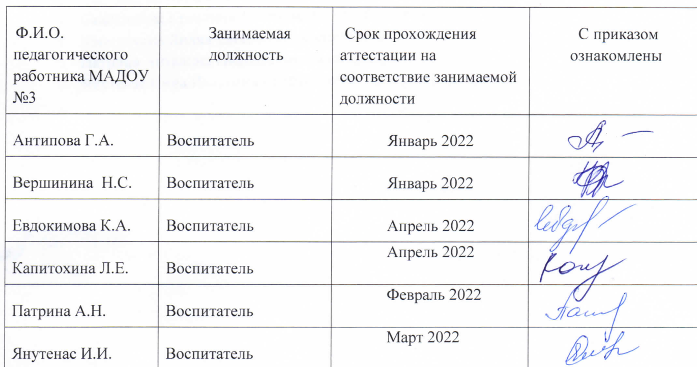
График проведения аттестации педагогических работников в целях подтверждения соответствия занимаемой должности в 2021-2022 уч. г.